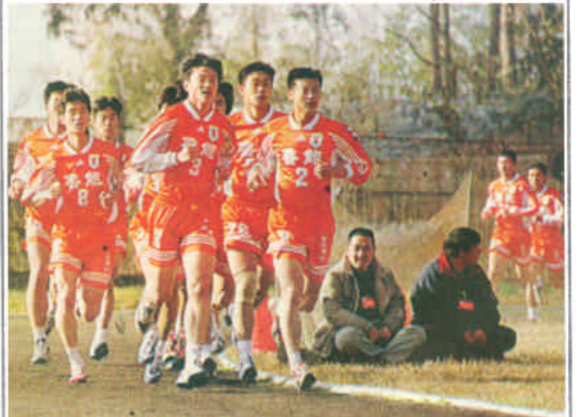
全国足球甲A春训1月23日在昆明海埂体育训练基地举行第二次体能测试。这是山东鲁能泰山队队员在12分钟跑中冲击终点。该队有19人参加测试，18人达标，是参加测试的14支甲A队中成绩最好的球队。

员的身手，但这位“飞人”今后注定只能在比赛中穿着西服革履露面。乔丹重返NBA令世界球迷兴奋鼓舞，这位创造了伟大奇迹的球员能否成为创造奇迹的老板，人们对他并不缺乏信心。新闻发布会刚刚结束，华盛顿上空热烈地传递着一个消息：飞人回来了！乔丹降落在华盛顿了！（杨明）